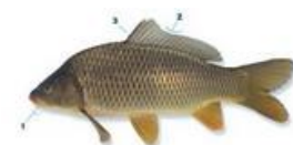
Karper Cyprinus carpio carpio