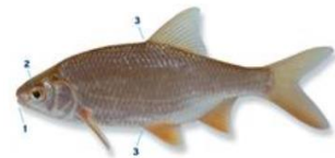
Blankvoorn Rutilus rutilus