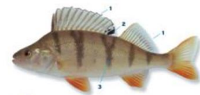
Baars Perca fluviatilis